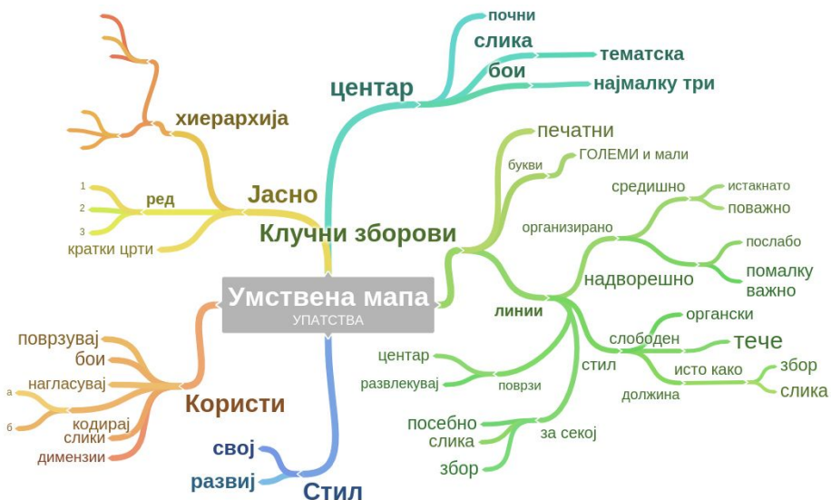
Слика 1. Ментална мапа на тема: „Како да изработите ментална мапа“ Извор: en.wikipedia.org, клучен збор „ментална мапа“ (mind map)