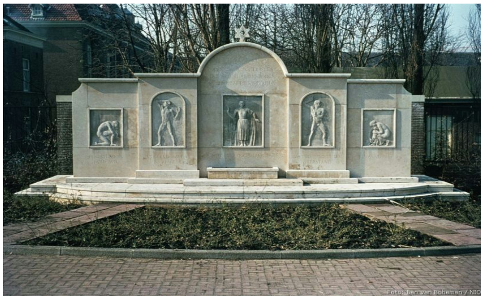
Слика 1. Ј.Г. Вертхајм (J. G. Wertheim), Споменик на еврејската благодарност, ( Jewish Gratitude Monument ), Амстердам, 1950.